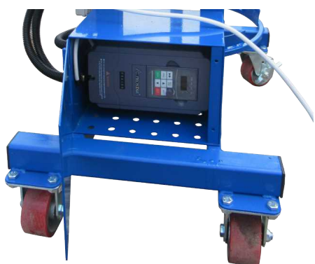
Программируемый частотный преобразователь