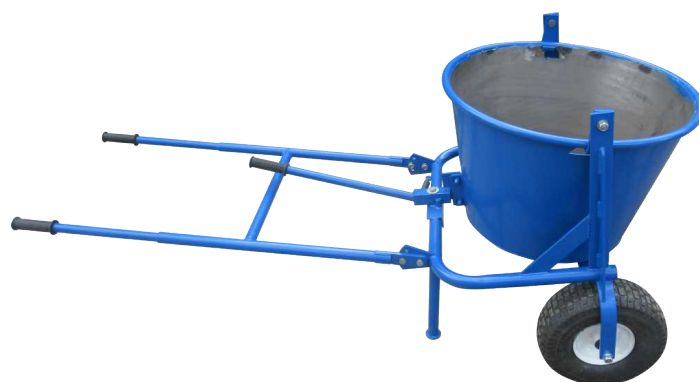
Ёмкость на 130 кг сухой смеси из прочной стали (2 шт. в комплекте)